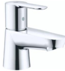
Fonteinkraan Grohe BauEdge