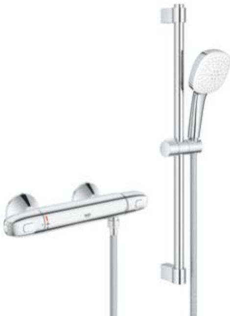
Douchemengkraan + glijstang Grohetherm 1000 + Tempesta