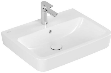
Wastafel (exclusief kraan) V&B O.Novo 60 cm