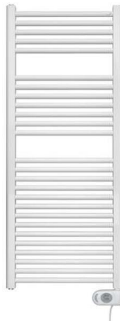
Elektrische handdoekradiator 910x500 mm Comfortline o.g. eigen thermostaat (radiator blijft gelijk bij optie B en C)