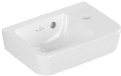
Fontein V&B O.Novo 36 cm.