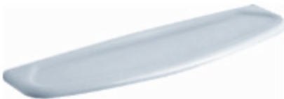
Planchet V&B O.Novo 60 cm