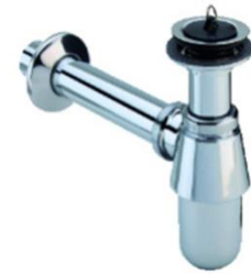
Afvoergarnituur Viega Plug / beker