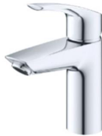
Wastafelkraan Grohe Eursosm.