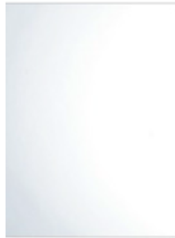
Spiegel 600x400 mm met spiegelklemmen