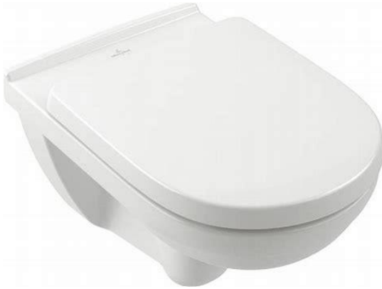
V&B O.Novo rimfree voorzien van softclose closetzitting.